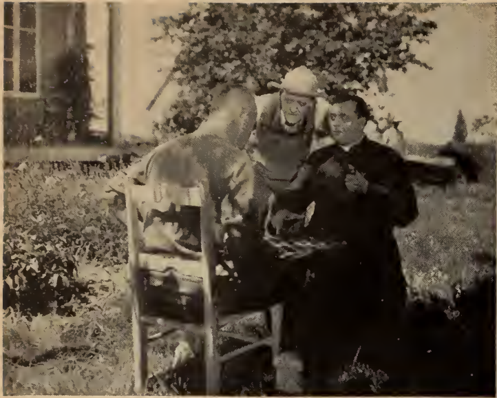
Le curé était de première force au jeu de dames.

nêtre. C'est depuis longtemps qu'il s'était promis de lui parler. Il s'était même dit que si la chose devenait nécessaire, il laisserait tomber une allusion du haut de la chaire, devant toute la paroisse réunie. Mais il préfère s'adresser aux sentiments chrétiens de Mme Théberge. Elle aime Lionel, oui, mais elle l'aime mal. C'est ça, la raison de sa conduite. Ce n'est pas vraiment à Juliette qu'elle s'oppose, c'est à la pensée qu'il lui faudra partager Lionel avec une autre. Qu'elle regarde dans son cœur comme si le bon Dieu y regardait en même temps qu'elle, et elle va tout comprendre. Que Mme Théberge fasse plaisir au bon Dieu, et aussi à son représentant, le prêtre, qui porte sur ses épaules le fardeau des autres, les chagrins des autres, qui ajoute à sa conscience la conscience des autres, avec les détours, les subtilités, les inquiétudes, les ruses que comporte toute conscience, et qui sombrerait souvent dans le pessimisme, s'il n'avait cet espoir, cette certitude de rencontrer de temps à autre un trésor, un joyau comme serait le repentir de Mme Théberge.