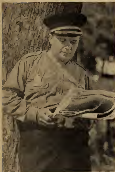
Le chef de police et des pompiers

Le visage du notaire se crispe affreusement. Il