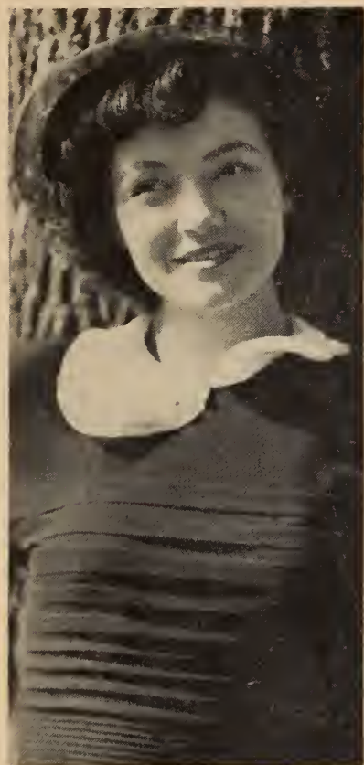
Juliette était sûrement la plus jolie villageoise de Saint-Vivien

Mme la mairesse ignore pourtant ce secret concernant Juliette. Quelles sont ses raisons, pour agir ainsi? Est-ce parce que le notaire Bellerose, élégant célibataire frisant la quarantaine, ne se gêne pas pour bourdonner autour de la jeune fille? Il n'est pourtant pas jus-