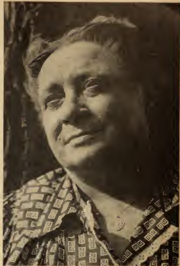
La ménagère chez Monsieur le curé

Par un beau samedi de juillet, M. le curé lisait tranquillement son bréviaire sans se douter du drame qui allait bientôt éclater.