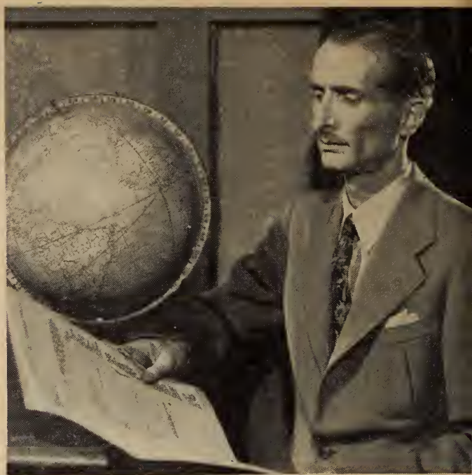
...le notaire Bellerose, élégant célibataire frisant quarantaine.

Il va pour poser une autre question, mais la phrase se perd dans un vague geste de remerciement; et l'homme se remet en route.