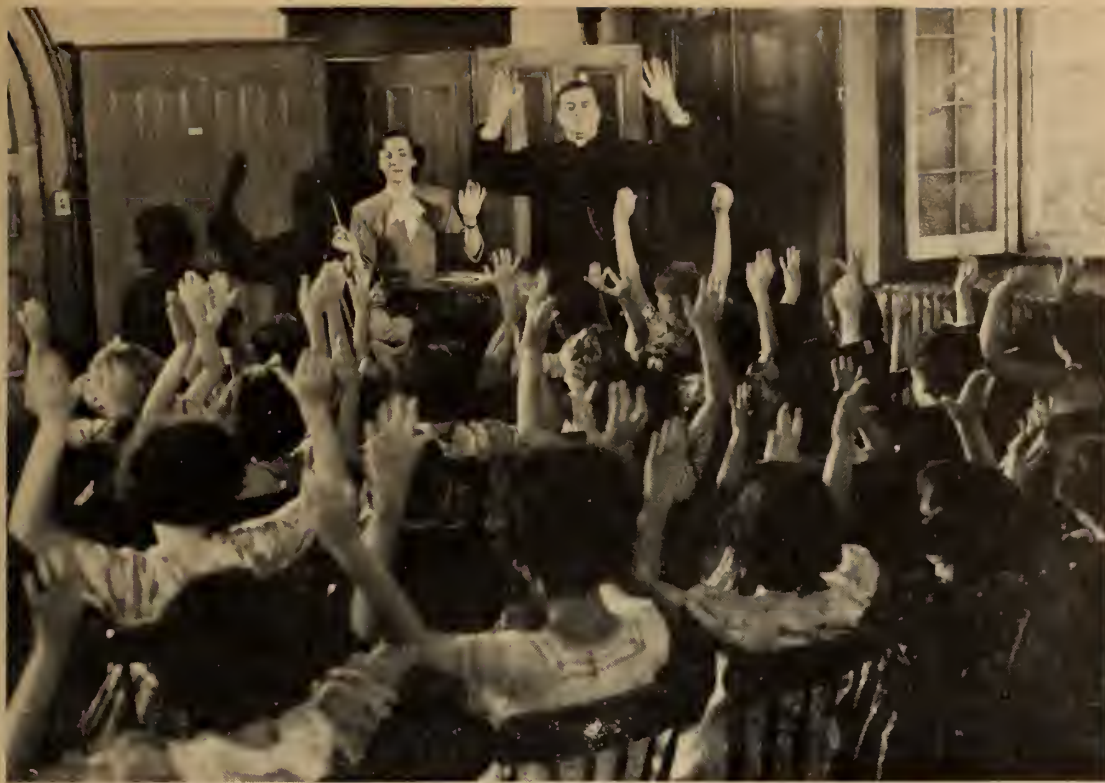
La visite de Monsieur le curé à l'école paroissiale était un événement fêté par un grand congé.