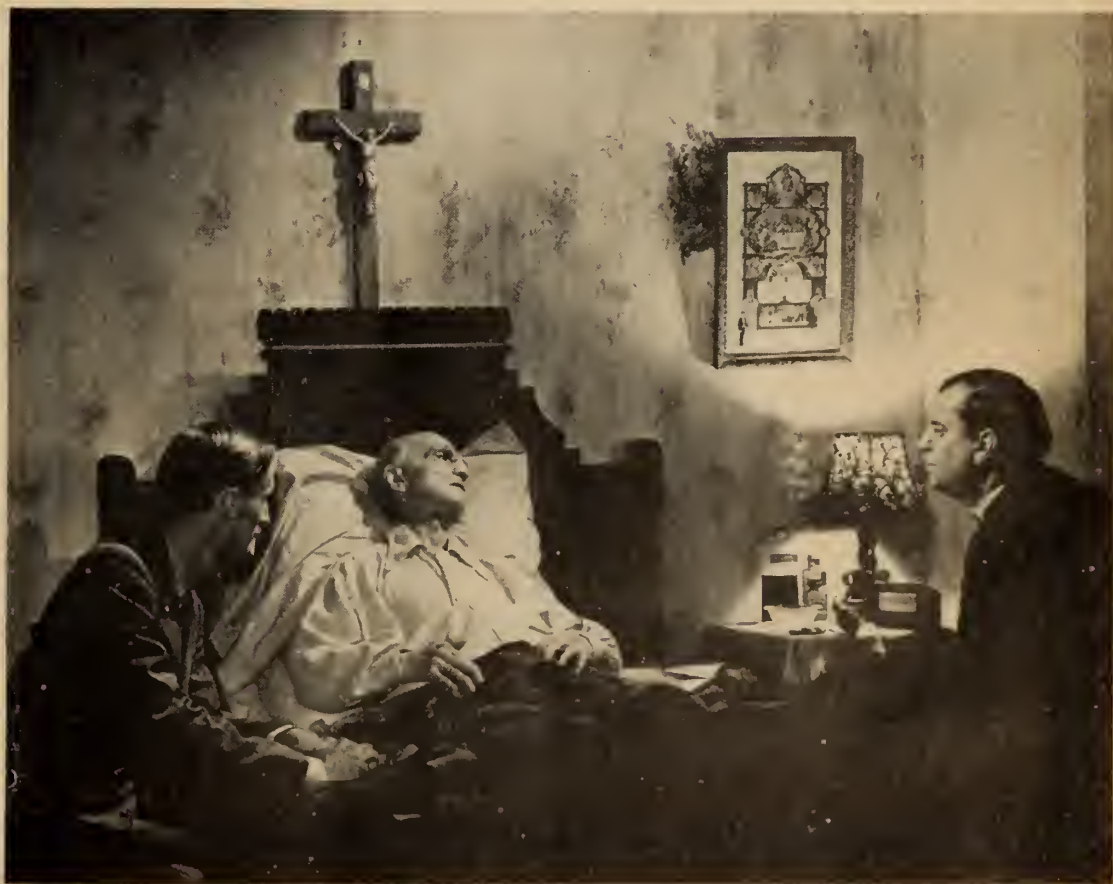
L'homme de Dieu avait recueilli, en présence du notaire, les dernières paroles de Castnguy qui allait entreprendre le grand voyage.

—Sur ce point je suis tranquille: le secret professionnel vous scelle la bouche. Jusqu'à ce que