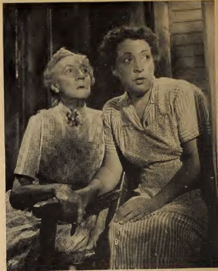
Les allures mystérieuses de l'étranger piquaient au plus haut point la curiosité des commères du village.

—Venez vous distraire de vos problèmes! renchérit