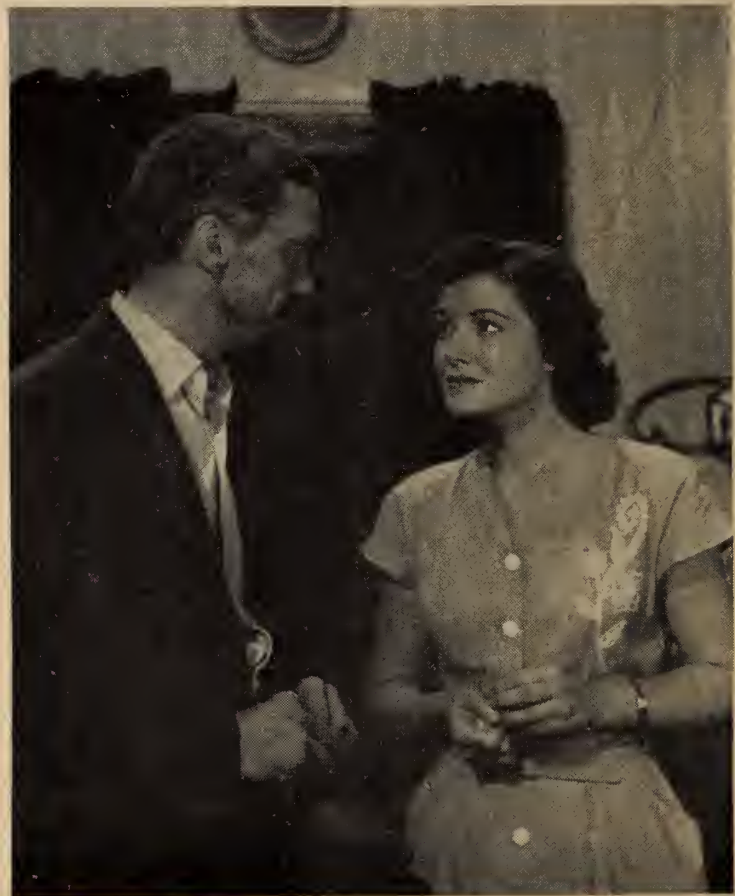
...et la conversation s'engagea entre l'étranger et Juliette.

—Sa mère, on l'appelait Georgina. Georgine, en français, mais aux Etats c'était Georgina. Son père, lui, on l'a toujours appelé "Frenchy". Je les ai ben con-