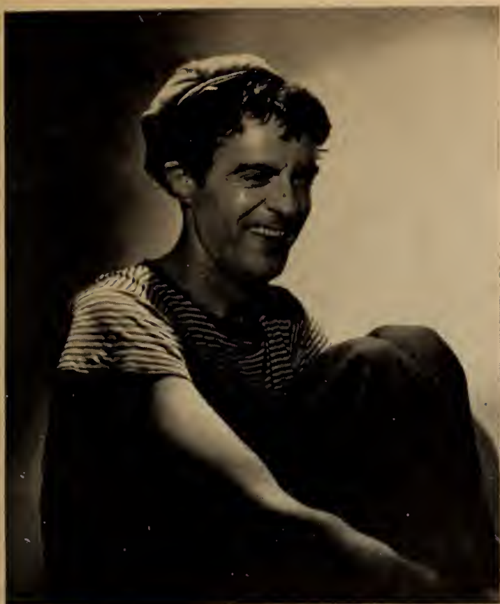
Noiraud était le bout-en-train du village.

nus, dans le temps. Pour ça que j'aimerais à voir leur fille.