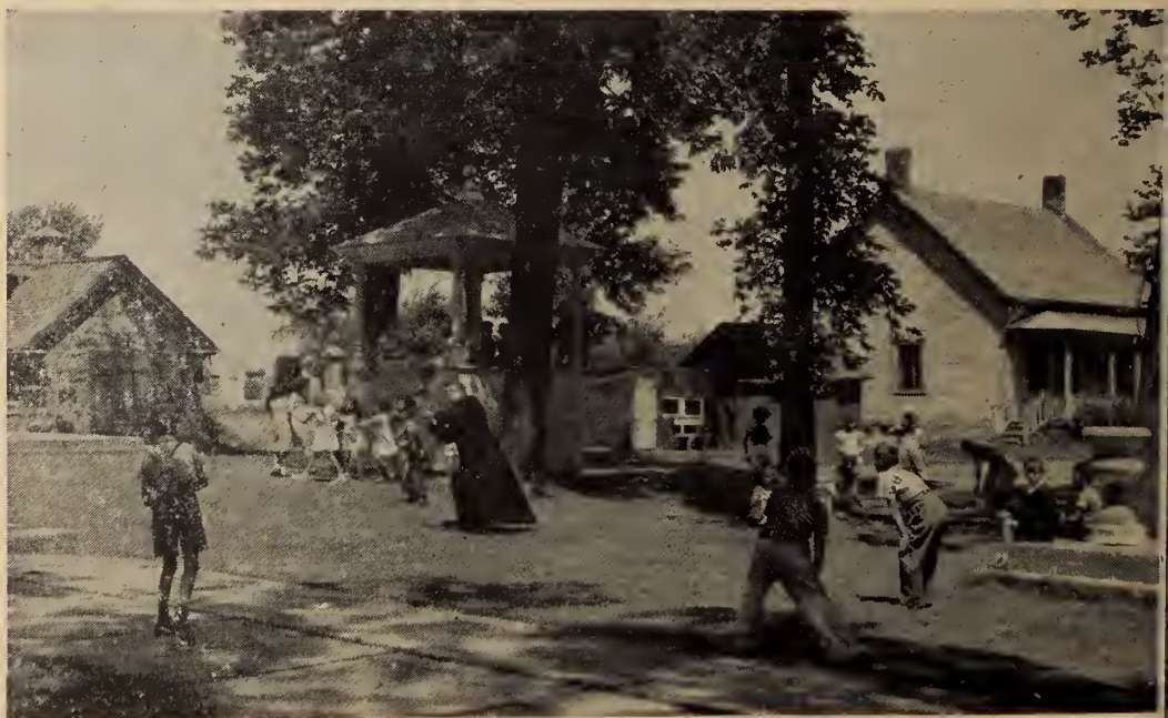
Monsieur le curé n'y allait pas de main morte lorsqu'il s'agissait de jouer la balle au camp avec ses jeunes paroissiens.